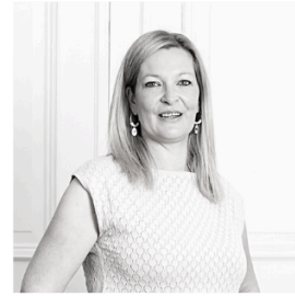
An Haenen Marketing & Relationships Manager